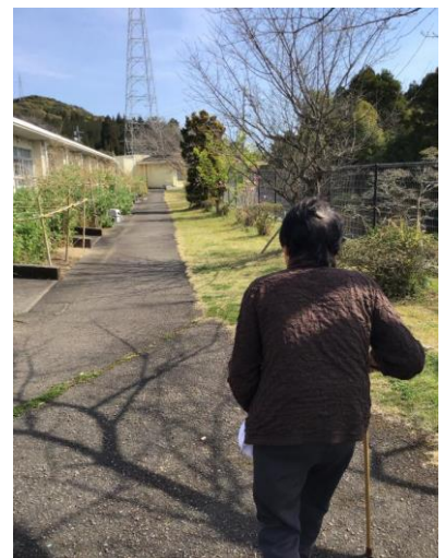
↑ 個別リハ(歩行訓練)