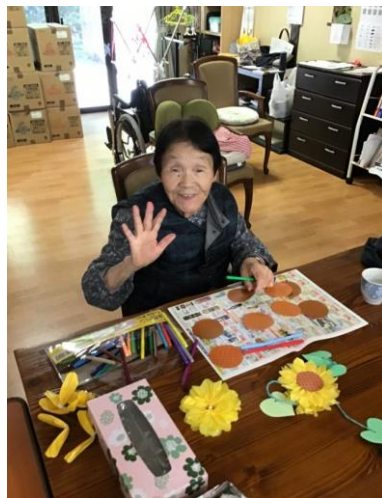
↑ グループ活動(季節の花づくり)